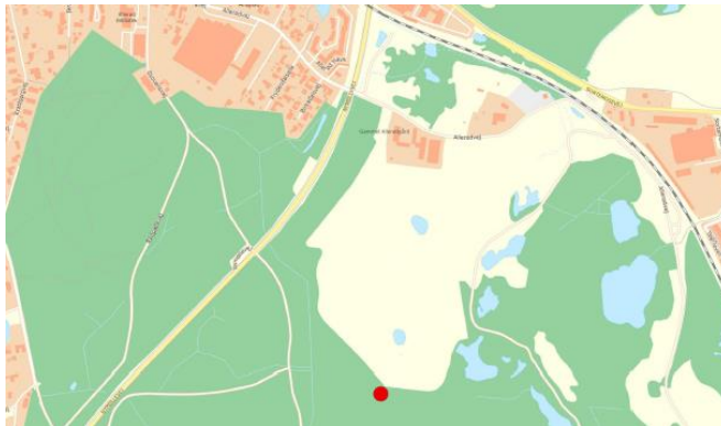
Shelteret placeres nord for Skovfogedvej, se rød markering.

I henhold til planlovens 1 § 35, stk. 1 meddeler Forvaltningen hermed landzonetilladelse til opførelse af et shelter.