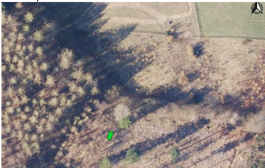
Placering for shelter (markeret med grøn) på satellitfoto fra 2022